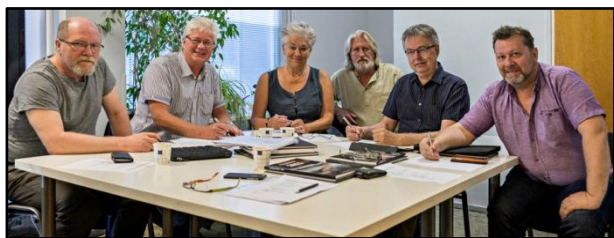
Bild från mötet i Helsingfors den 18 augusti.

Den 18 augusti 2015 bildades Nordiska Förbundet för Fotografi vid ett möte mellan Riksförbunden i Sverige, Norge och Finland.