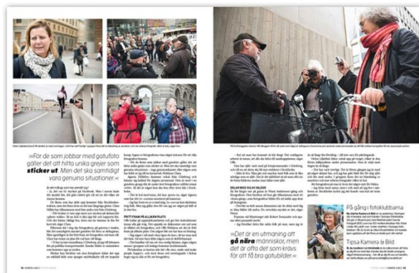
Från Kamera&Bild nummer 11, 2015.